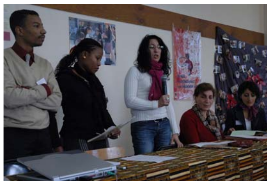
Les Universités de Pierre Bénite, Saint Génis Laval, Pau, Lille, Lezennes et Vénissieux