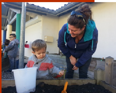
Des travaux de plantation et de taille sont réalisés par l'équipe et les familles

A la maison des p'tits bouts (Veurey-Voroize), les permanences obligatoires des parents ont disparu et la place du parent a changé. Le label parental nous a donné l'occasion de redéfinir cette place et de proposer différentes façons de participer en tant que parent :